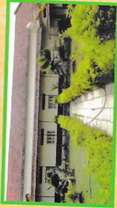
Auditorium of the College