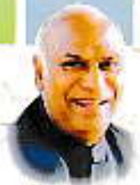
Dr. Mallikarjun H. Kharge Founder Chairman