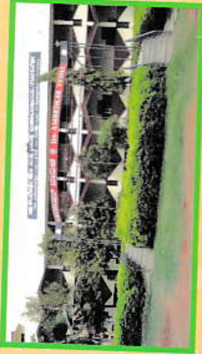
Open Air Theatre